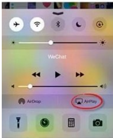
devices before iOS 10