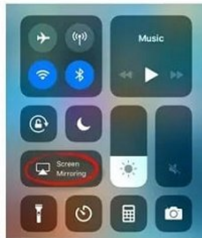
iOS 11 devices

4- بعد از آن، Airplay به شما دستگاه‌های میزبان شده در دسترس در داخل شبکه وای‌فای را نشان می‌دهد. دستگاه خود را انتخاب کنید و سپس گزینه "Mirroring" را فعال کنید.