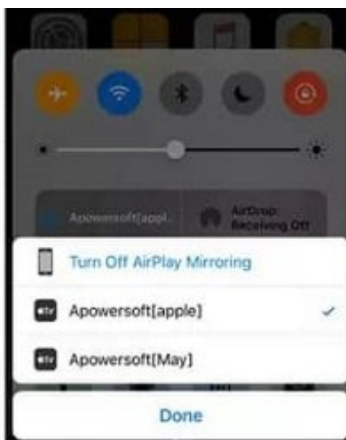
iOS 10 devices