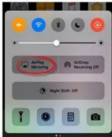
iOS 10 devices