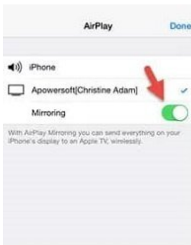
devices before iOS 10

4- بعد از آن، Airplay به شما دستگاه‌های میزبان شده در دسترس در داخل شبکه وای‌فای را نشان می‌دهد. دستگاه خود را انتخاب کنید و سپس گزینه "Mirroring" را فعال کنید.