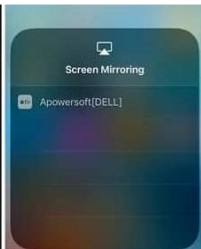
iOS 11 devices

5- حالا برای ضبط صفحه گوشی آیفون روی دکمه 'Start Recording' تپه بزنید.