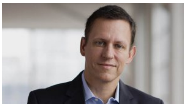
۱۰ رمز موفقیت کارآفرینان از زبان موسس میلیاردر پی‌پال