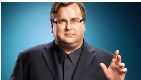
۱۰ رمز موفقیت کارآفرینان از زبان بنیان‌گذار لینکدین