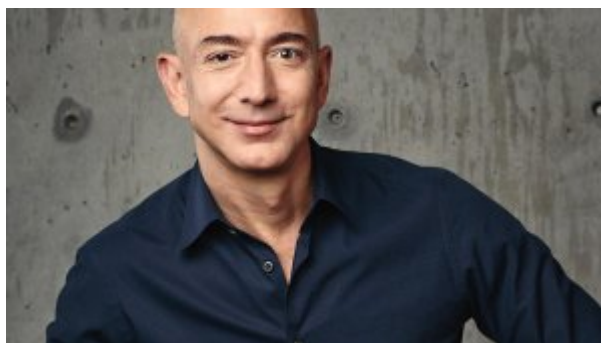
۱۰ رمز موفقیت کارآفرینان از زبان بنیان‌گذار سایت آمازون