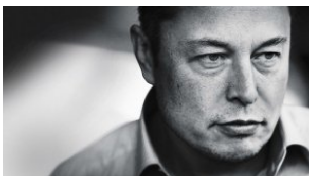
۱۰ رمز موفقیت کارآفرینان از زبان میلیاردر تغییردهنده جهان