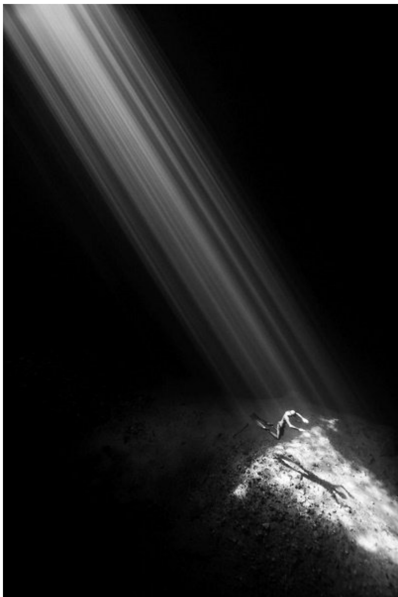
عکاس زیر آب سال انگلستان، عکس "پرنندگان عشق" توسط گرانت توماس از بریتانیا با 205 امتیاز