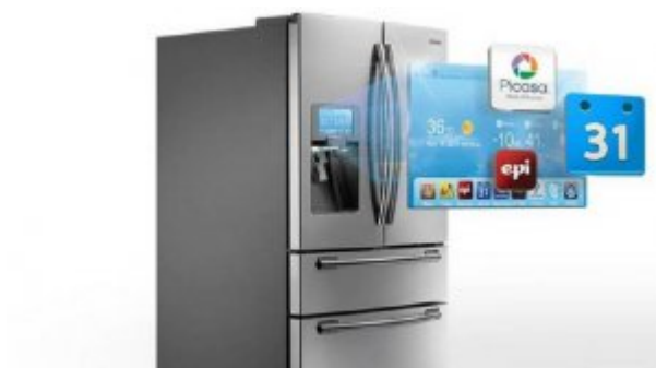
حمله سایبری به یخچال برای دسترسی به اطلاعات جی میل