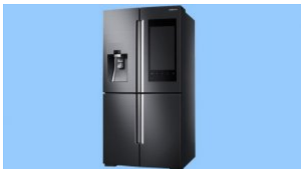
CES 2016: از راه دور درون یخچال سامسونگ سرک بکشید + تصویر