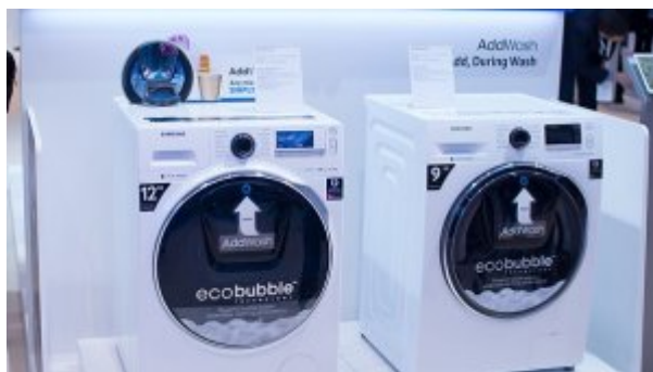
ورود ماشین لباسشویی پر سروصدای سامسونگ به بازار ایران