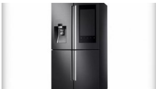
اولین تصاویر از یخچال هوشمند سامسونگ با صفحه نمایش لمسی بزرگ