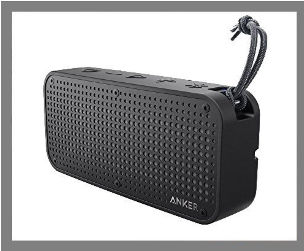
یک اسپیکر بلوتوث

فهرستی که در ادامه مشاهده خواهید کرد شامل مجموعه‌ای از محصولات با کیفیت و کاربردی است که قیمتی زیر 100 دلار دارند و برای کسانی که به دنبال فناوری روز هستند عالی است.