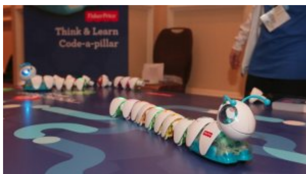
CES 2016: کرم روبانی که به کودکان سه ساله کدنویسی آموزش می‌دهد