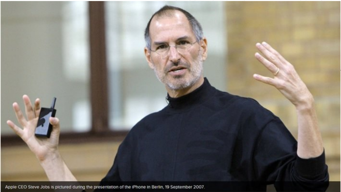
Apple CEO Steve Jobs is pictured during the presentation of the iPhone in Berlin, 19 September 2007.

سالیان سال است که آنرا مشاهده می‌کنیم. iMac, iPod, iTunes, iPhone, iPad در همه جا پیشوند کاراکتر i به عنوان یک بخش ثابت از محصولات پر فروش اپل مشاهده می‌شود. درست از سال 1998 میلادی که این کاراکتر را همراه با iMac مشاهده کردیم. این کاراکتر به یک بخش جدایی‌ناپذیر از محصولات اپل در آمده است. اما چرا؟ به‌راستی معنای آن چیست؟