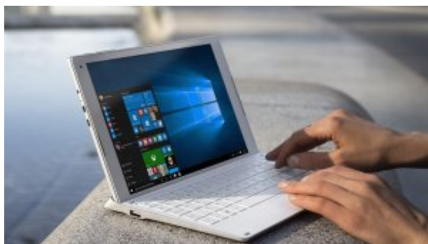
گالری عکس: اولین تبلت دو کاره آلکاتل با دو باتری، LTE و ویندوز 10