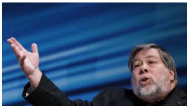
بی‌علاقه‌گی بنیان‌گذار اپل به آی‌پد پرو و اپل واچ!