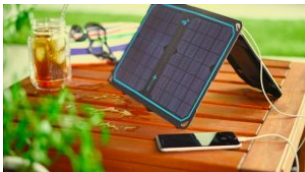
CES 2016: گجتی برای شارژ رایگان تلفن همراه و تبلت با انرژی خورشید