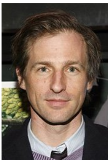
Spike Jonze (کارگردان و نویسنده)