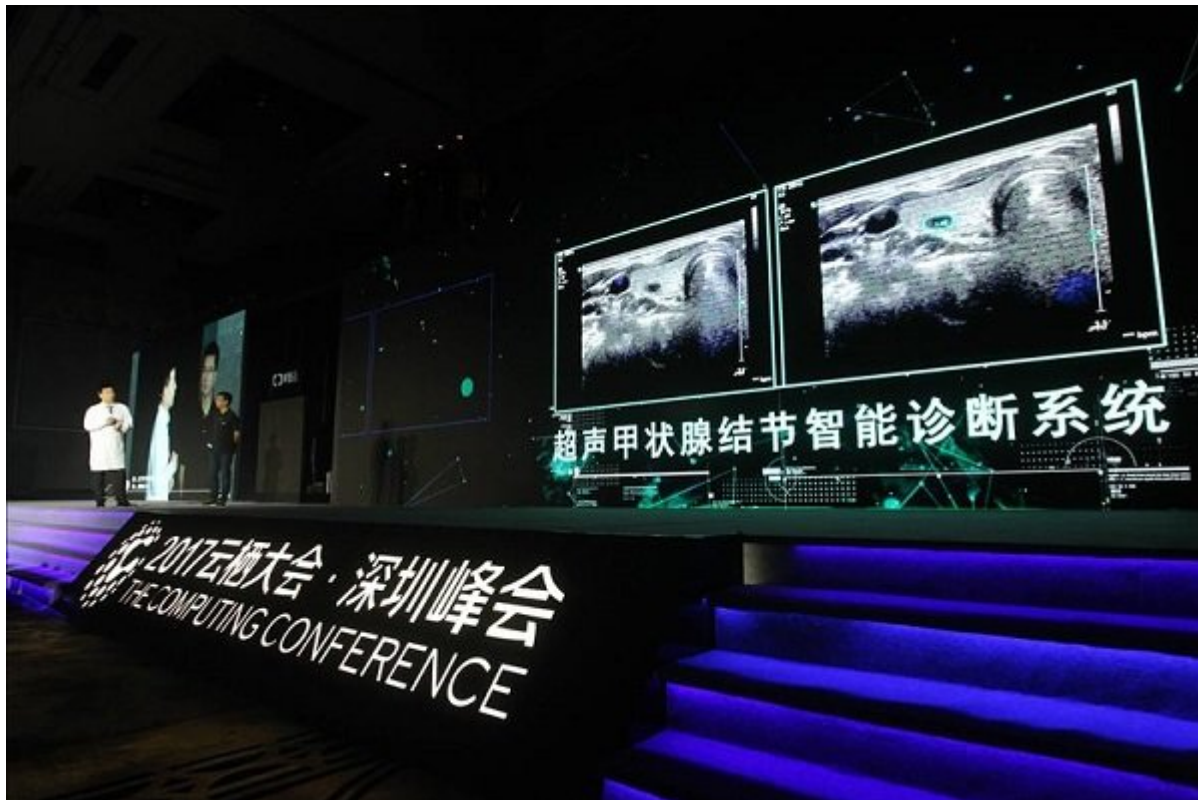
شکل 2- خدمات ابری «علی‌بابا» در حوزه‌های مختلفی از شهرهای هوشمند و ترافیک شهری تا سیستم‌های سلامتی و هوشمندسازی بیمارستان‌ها را شامل می‌شود.

«علی‌بابا کلاود» به سرعت شرکت‌های ارائه‌دهنده خدمات ابری کوچک‌تر را خریداری کرده یا به شرکای تجاری خود اضافه می‌کند. طی سال‌های اخیر، «علی‌بابا کلاود» موفق به شراکت با کسب‌وکارهای بزرگی مانند China National Petroleum Corporation، Malaysia Digital Economy Corporation و Cathay Pacific شده است. همین‌طور موفق شده با فیفا برای اسپانسر و همکاری در برگزاری مسابقات جام باشگاه‌های جهان تا سال 2022 قراردادی منعقد کند که در ادامه مفصل درباره‌اش صحبت خواهیم کرد. در پروژه‌ها ساخت چندین شهر دیجیتالی مانند برلین و هند همکاری دارد و زیرساخت‌های عظیمی از شهرداری‌ها مانند سیستم کنترل ترافیک شهر کوالالامپور مالزی را برعهده گرفته است. «علی‌بابا» از طریق یکی دیگر از شرکت‌های تابعه‌اش به نام AliCloud می‌خواهد با استفاده از هوش مصنوعی و کامپیوترهای ابری ترافیک شهرهای بزرگ دنیا را کنترل و مدیریت کند.