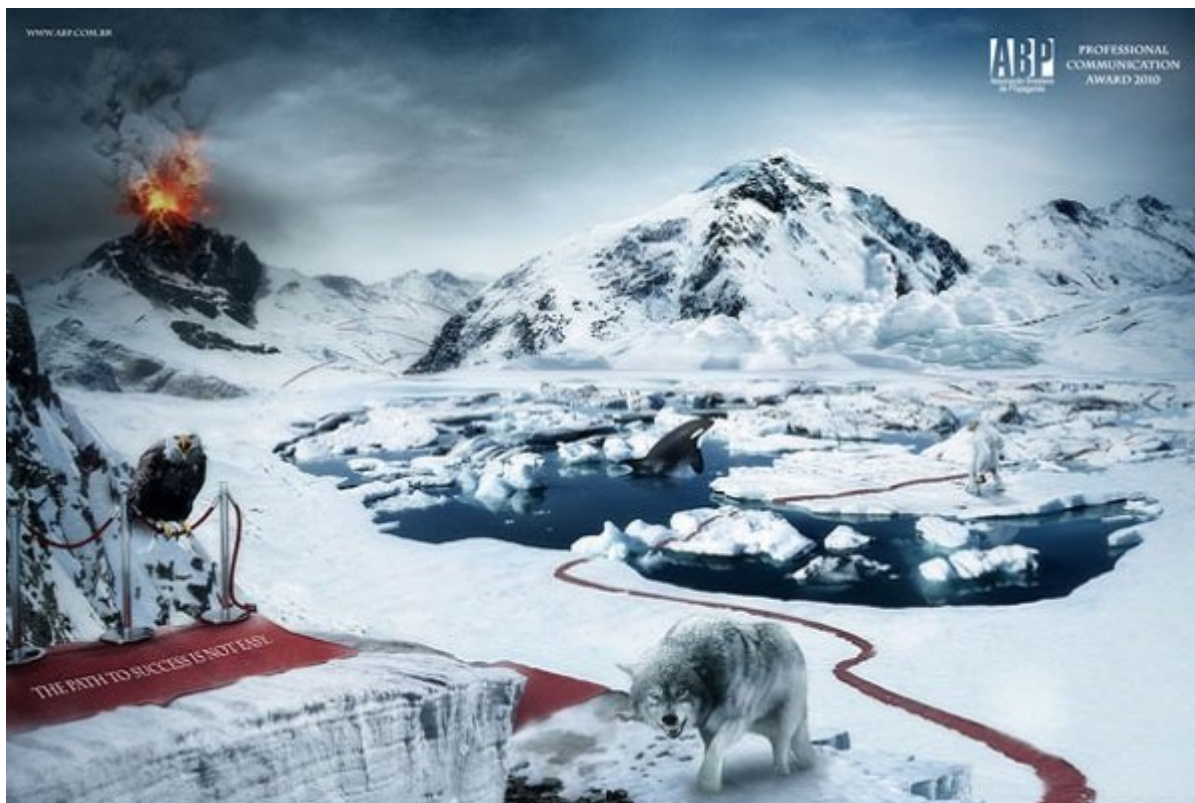
شرکت تبلیغاتی ABP: مسیر موفقیت آسان نیست