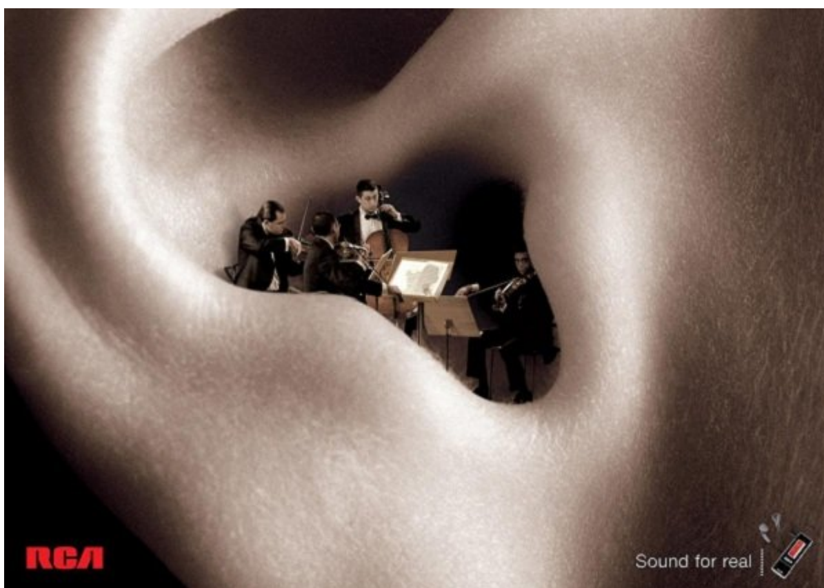
هدفون RCA: صدای واقعی