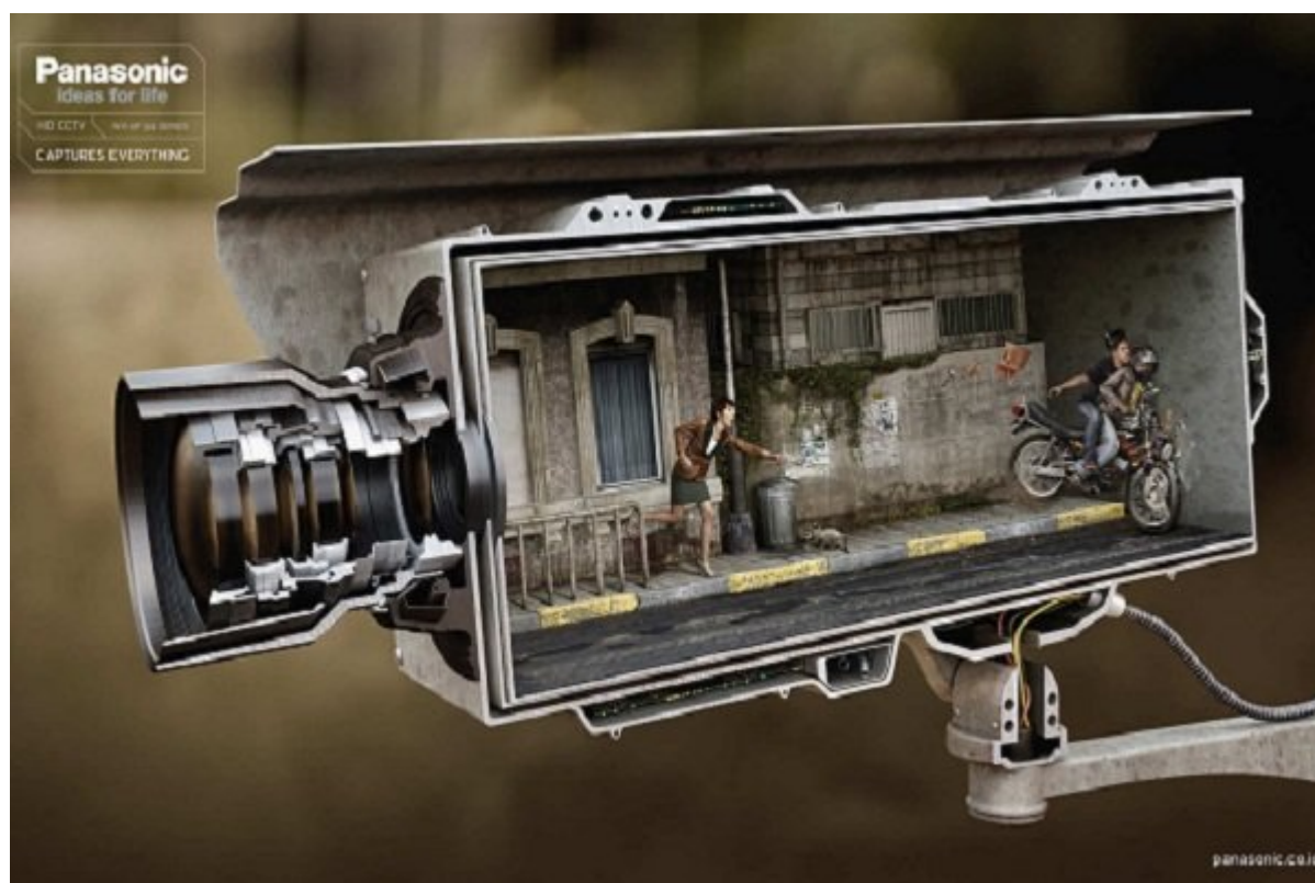
دوربین مدار بسته Panasonic: همه چیز را می بیند