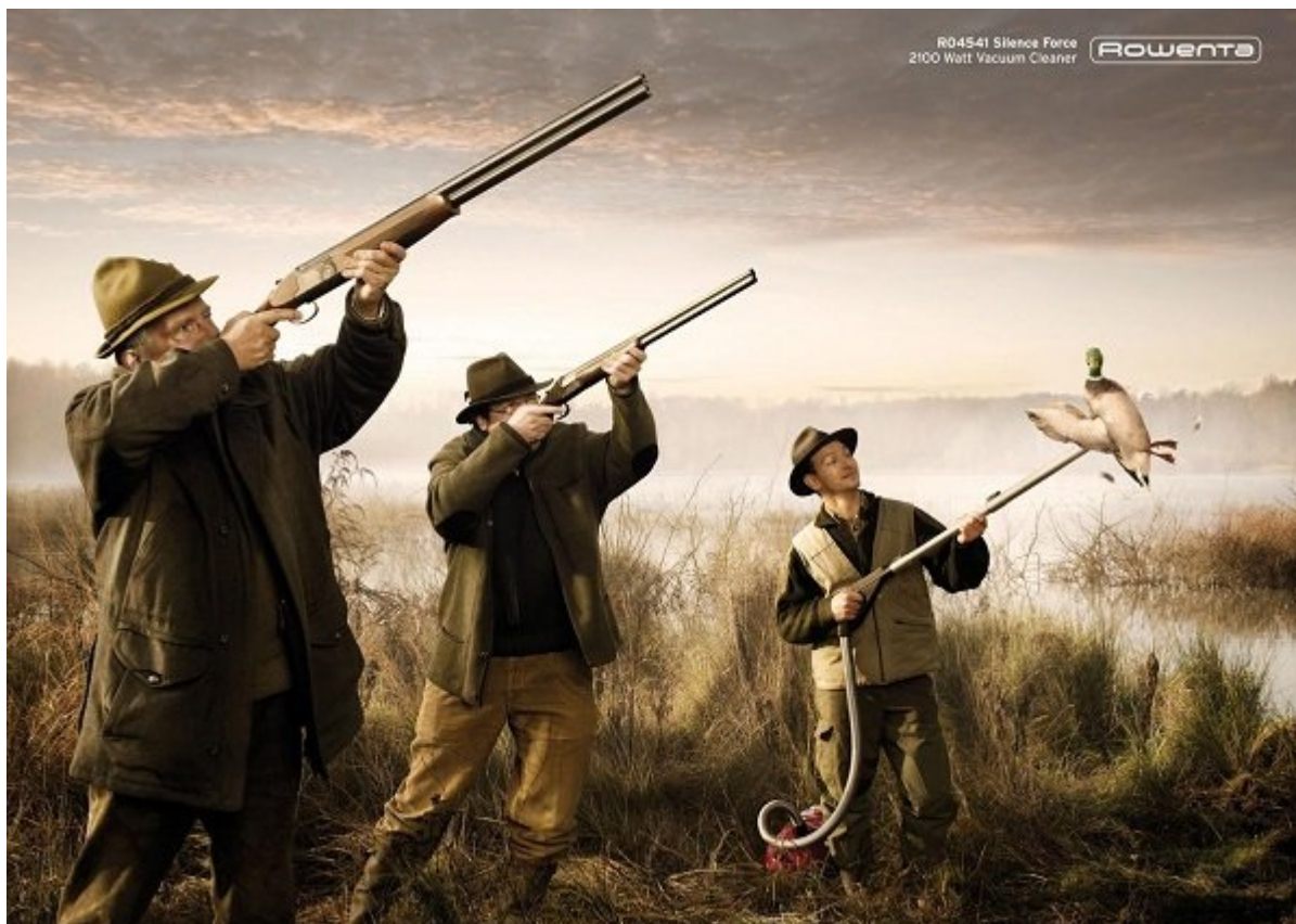
جارو برقی Rowente: نیروی بی‌صدا با 2100 وات قدرت