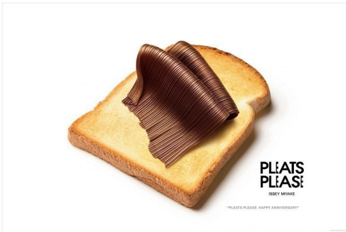
PLEATS PLEASE: رنگ موی شکلاتی