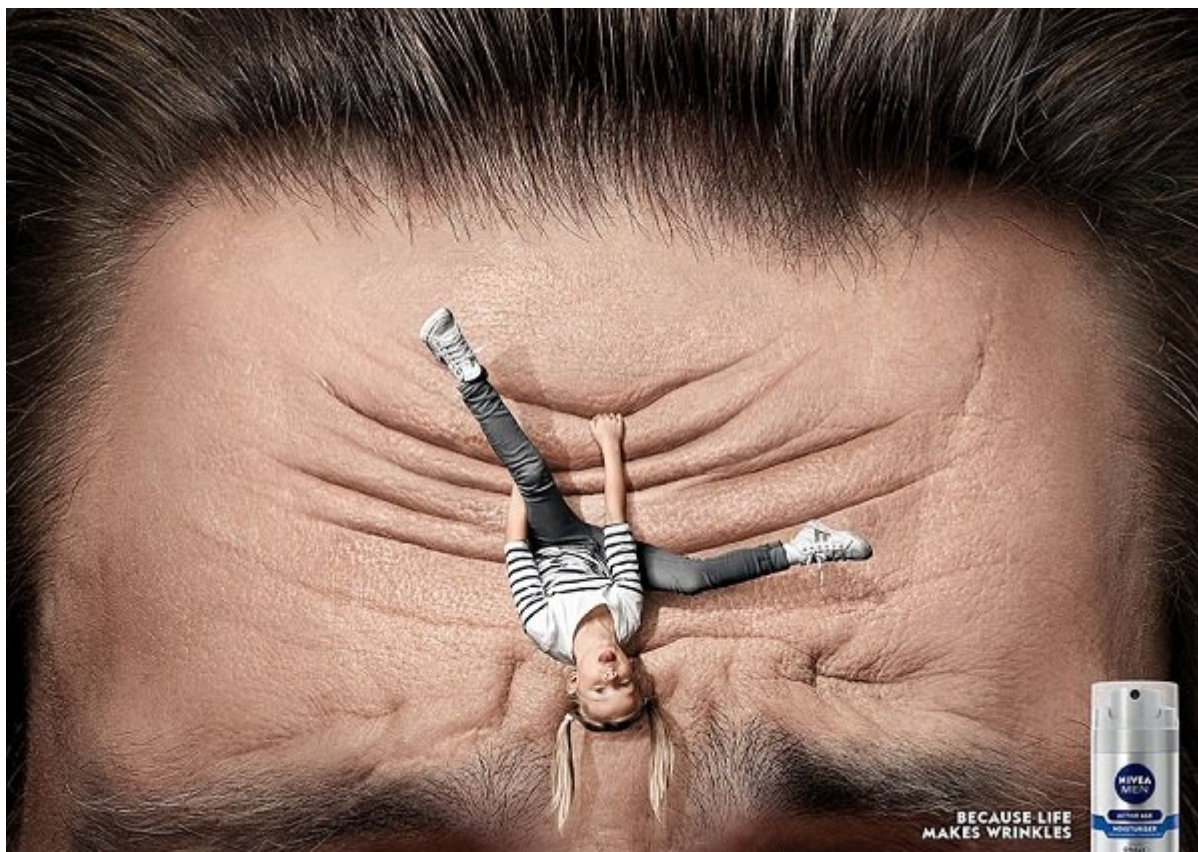
اسپری مردانه NIVEA: چون زندگی باعث چین و چروک می‌شود