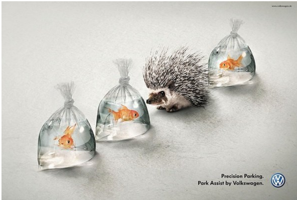
Volkswagen: پارک دقیق