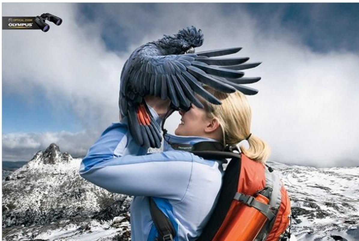
دوربین OLYMPUS: زوم اپتیکال